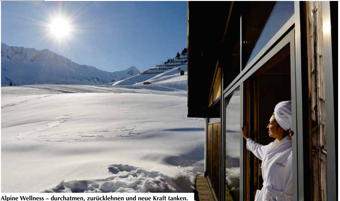
Alpine Wellness – durchatmen, zurücklehnen und neue Kraft tanken.