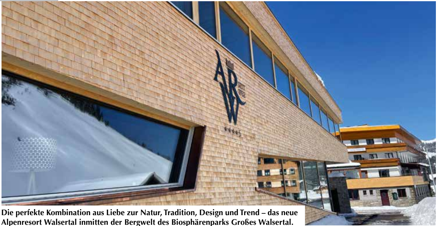
Die perfekte Kombination aus Liebe zur Natur, Tradition, Design und Trend – das neue Alpenresort Walsertal inmitten der Bergwelt des Biosphärenparks Großes Walsertal.