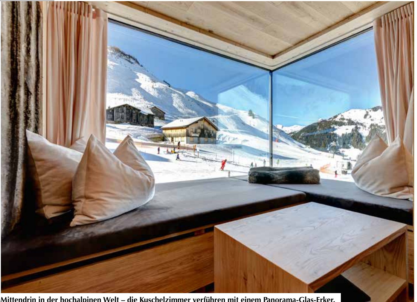
Mittendrin in der hochalpinen Welt – die Kuschelzimmer verführen mit einem Panorama-Glas-Erker.