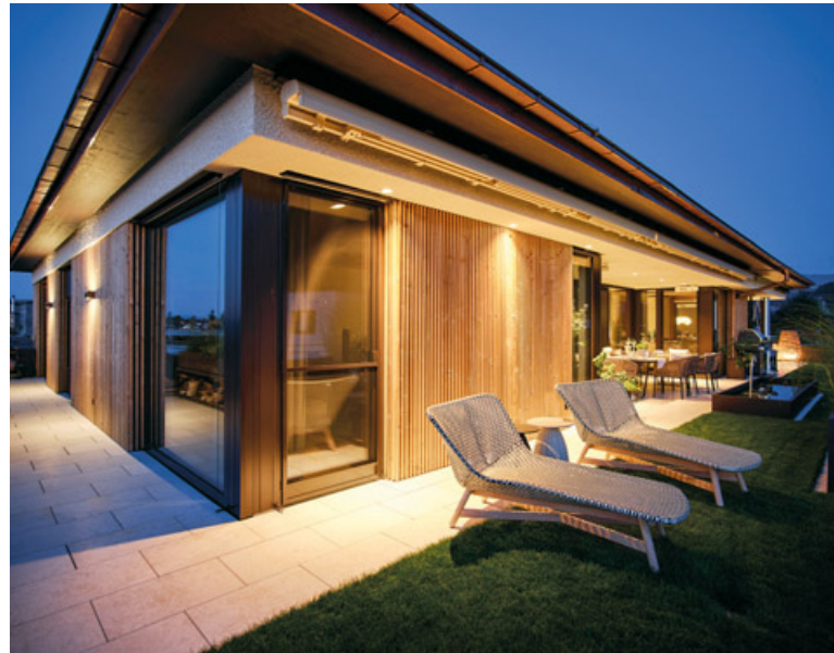
Stylishes Ambiente durch das gefühlvolle Planungskonzept der Möbel und der gesamten Inneneinrichtung von der Tischlerei Müller Karl GmbH, Altbach.

konzept. Eine gezielte Atmosphäre zum Wohlfühlen erzeugen die effektvollen Licht-Akzente, die vom Dornbirner 'Licht & Form'-Inhaber Bernd Nagel eingesetzt wurden.